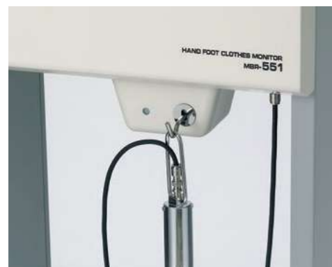
衣服用検出器は装置中央または、右側面へ取り付け可能です。設置場所等に合わせて、お選び下さい。

この装置は、放射性物質を取り扱う病院、研究所、大学などの管理区域内に設置し、作業者の手、足、衣服などの表面汚染を検知するモニタです。人の手足に付着した放射性物質による \beta(\gamma) 線を検出し、あらかじめ設定した警報レベル以上であれば、警報を発すると同時に手、足などの汚染部位を表示します。また衣服用検出器は単独で使用できるので、衣服の汚染チェックはもとより、ほかの部位の汚染モニタとしても使用できます。バックグラウンド自動減算機能に加え、短時間判定機能やカラーLCD表示器の採用により使いやすくなりました。