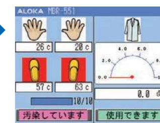
汚染のある場合(部位が赤色点滅)