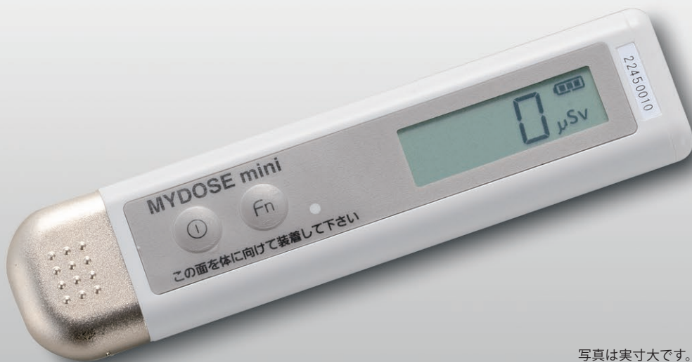
写真は実寸大です。