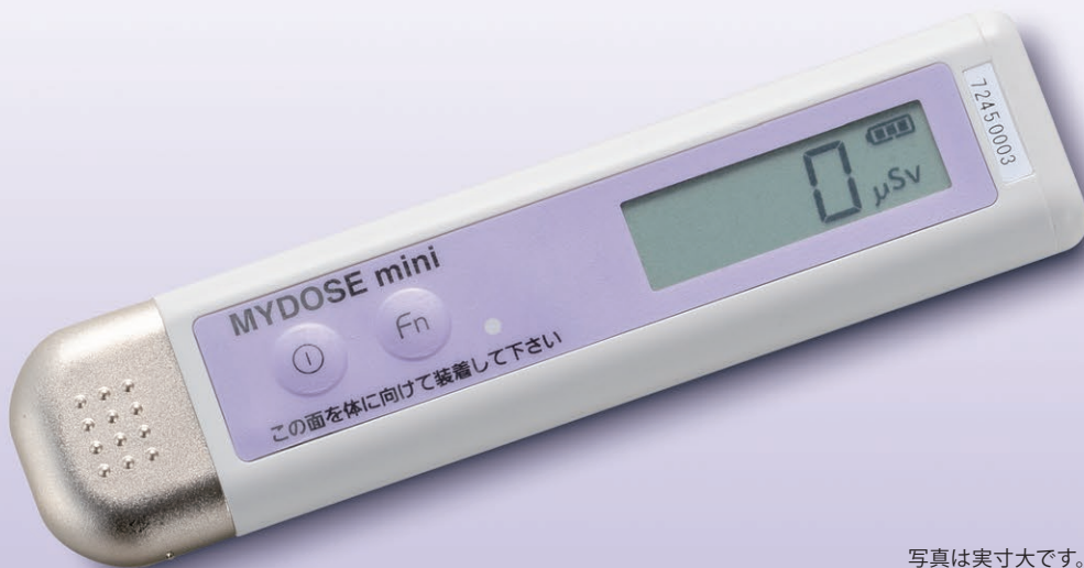
写真は実寸大です。